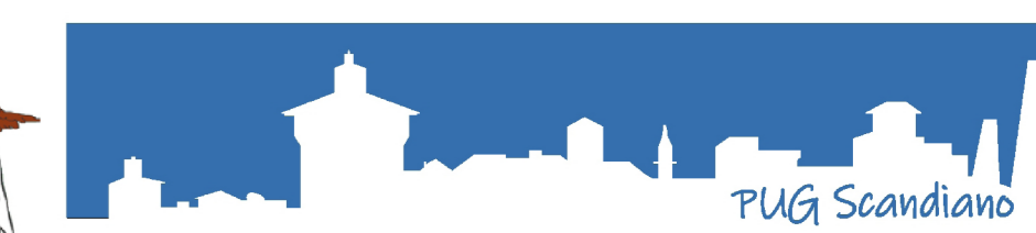
TAVOLA DEI VINCOLI