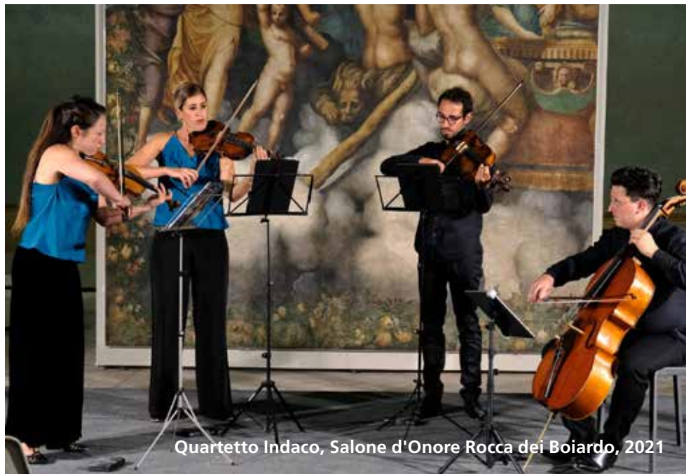
Quartetto Indaco, Salone d'Onore Rocca dei Boiardo, 2021