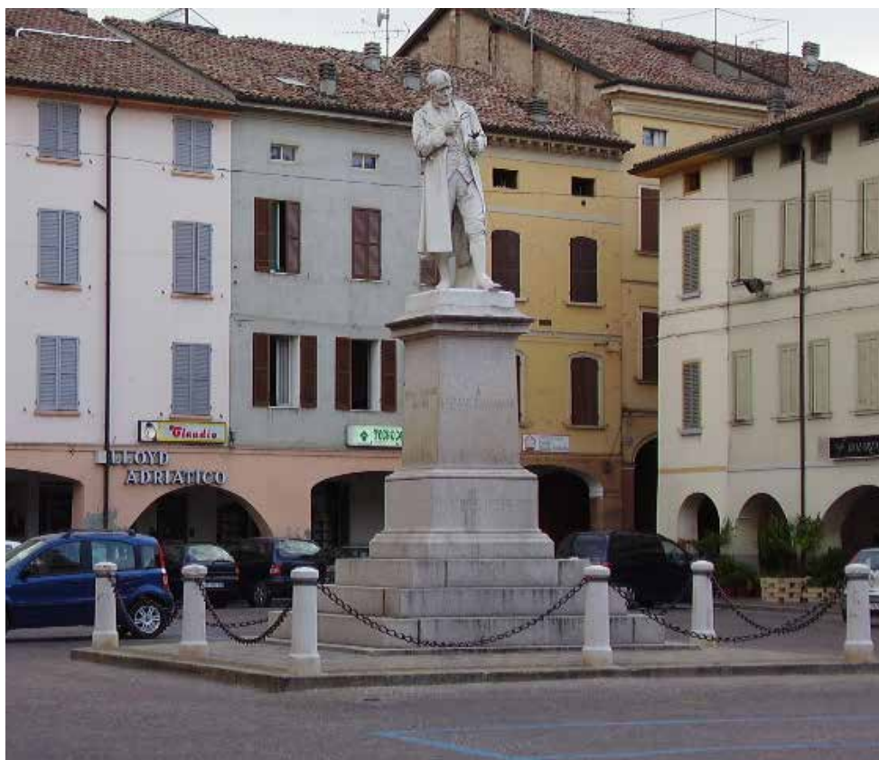
Piazza Spallanzani sarà oggetto di un intervento

La stessa logica di sostenibilità che ha spinto l'amministrazione a prevedere, quanto al piano degli investimenti, cospicui interventi sul patrimonio pubblico mirati all'efficiamento energetico, alla sicurezza e alla riqualificazione e rigenerazione urbana.