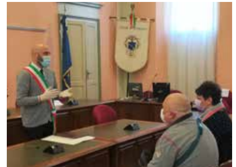
Un matrimonio al tempo del Covid

Il 15 giugno arriva l'ordinanza di chiusura del Coc che segna anche la fine della parte emergenziale. L'ospedale pian piano si svuota di pazienti Covid e torna alla normalità, restano temporaneamente chiusi Pronto Soccorso e Punto Nascita: il peggio alle spalle ma occorre tenere l'attenzione ancora molto alta per evitare ricadute.