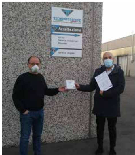
Mascherine donate da un'azienda scandianese