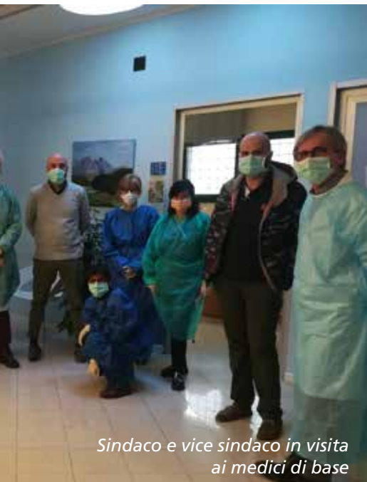
Sindaco e vice sindaco in visita ai medici di base

diventa Ospedale Covid, gli spostamenti sono difficilissimi, le aziende chiudono e chi può lavora in modalità smartworking, si svuotano strade, piazze, uffici pubblici. Il conto dei contagi è sempre più rilevante e anche a Scandiano si inizia a contare le decine, non più le unità.