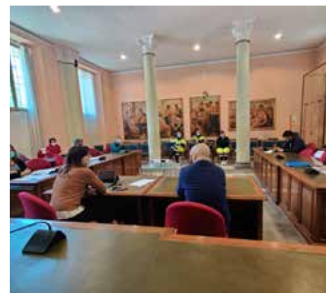
Il sindaco firma i cartellini di riconoscimento dei volontari di "Scandiano Aiuta"

Alla persona che risponde al telefono, messa a disposizione del Comune per questo servizio, sarà sufficiente dettare le proprie generalità, il proprio indirizzo e la lista della spesa, scegliendo tra una lista precompilata di generi di prima necessità (pane, pasta, acqua, frutta e verdura confezionata...) e attendere che, il giorno dopo la prenotazione, un volontario delle associazioni coinvolte vada a ritirare la spesa. A quel punto, solo all'esibizione dello scontrino, il fruitore del servizio potrà pagare al volontario la spesa. I volontari delle associazioni hanno avuto un tesserino identificativo timbrato dal Comune.