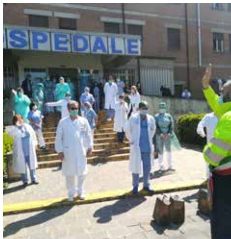
Falsh mob davanti al Magati