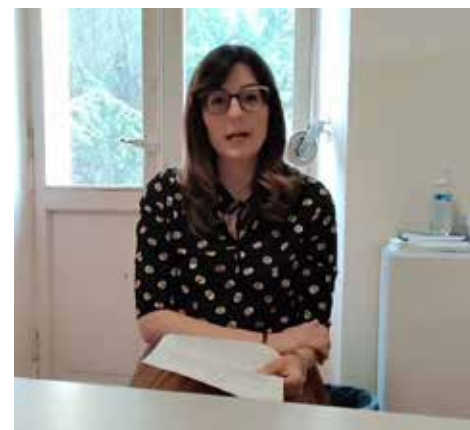
Assessore Elisa Davoli

spendibili in esercizi del territorio del Comune di Scandiano che hanno aderito al progetto, consultabili all'indirizzo https://www.comune.scandiano.re.it/negozi-nei-quali-utilizzare-i-buoni-spesa/ .