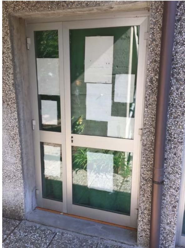
Fronte sud. Particolare portafinestra aula di musica