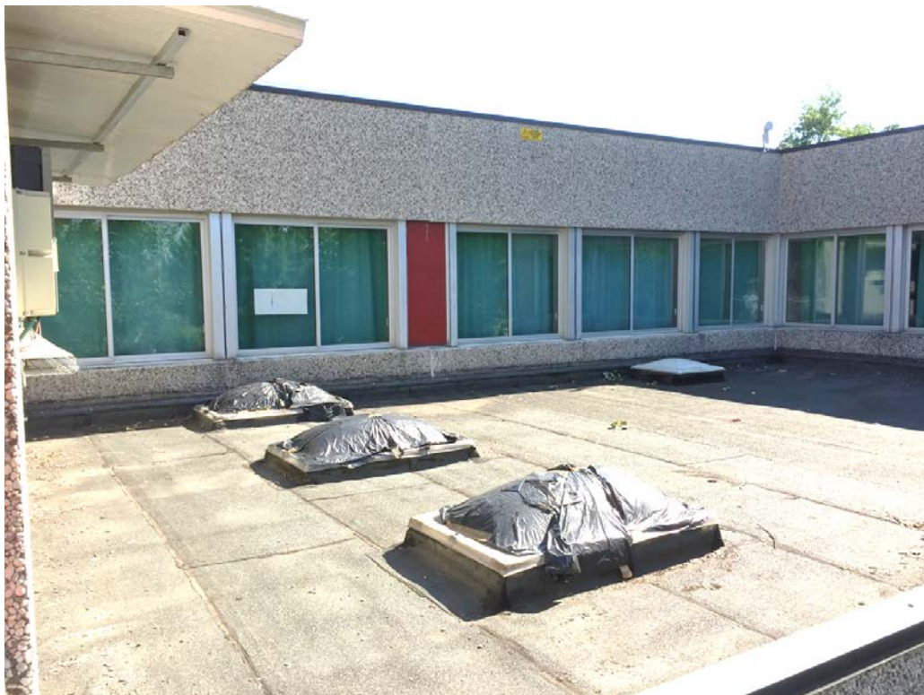
Fronte sud. Particolare serramenti al primo piano