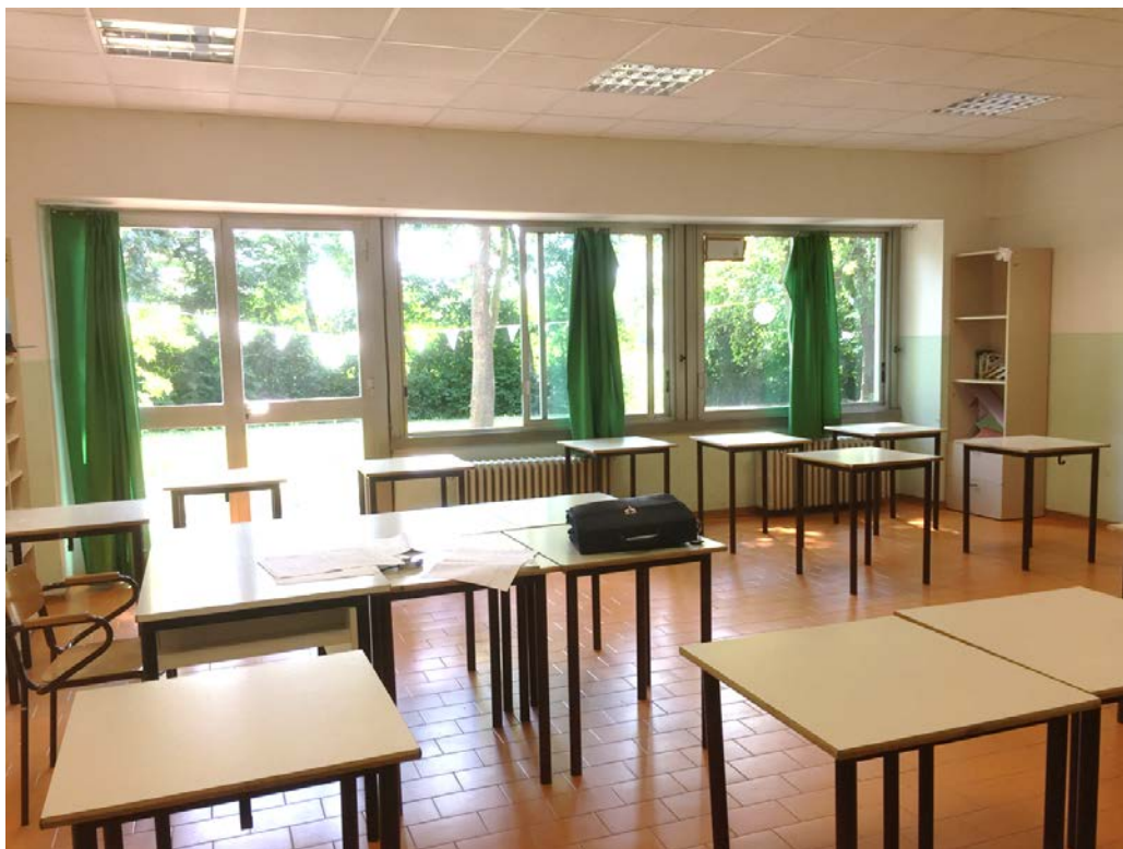
Particolare serramenti al primo terra