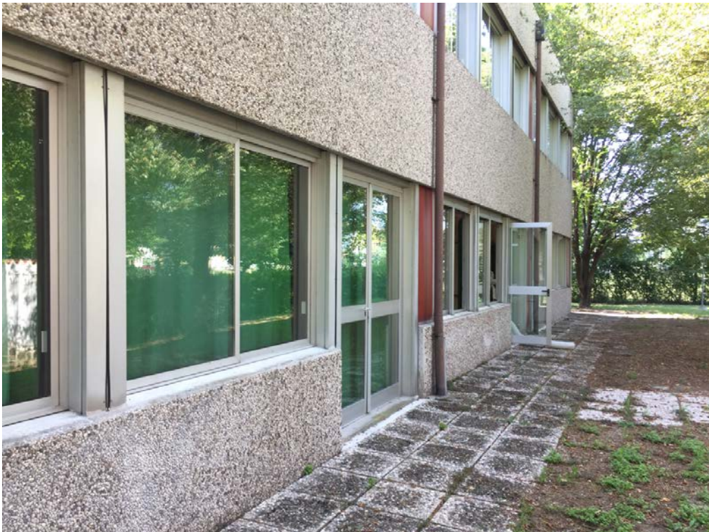
Fronte ovest visto da nord