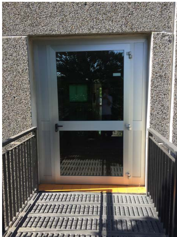
Fronte nord. Dettaglio porta antipanico al primo piano.