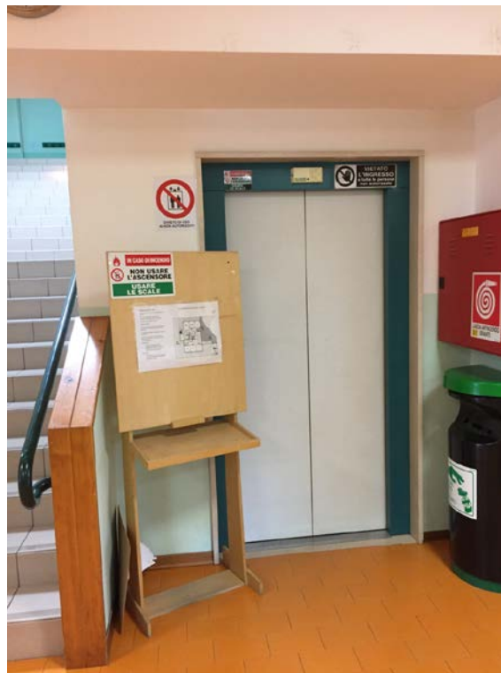
Ascensore all'interno della scuola