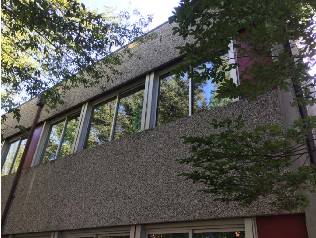
Fronte ovest. Particolare serramenti sopra aula di musica