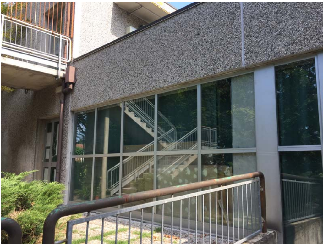
Fronte sud. Particolare serramento teatrino