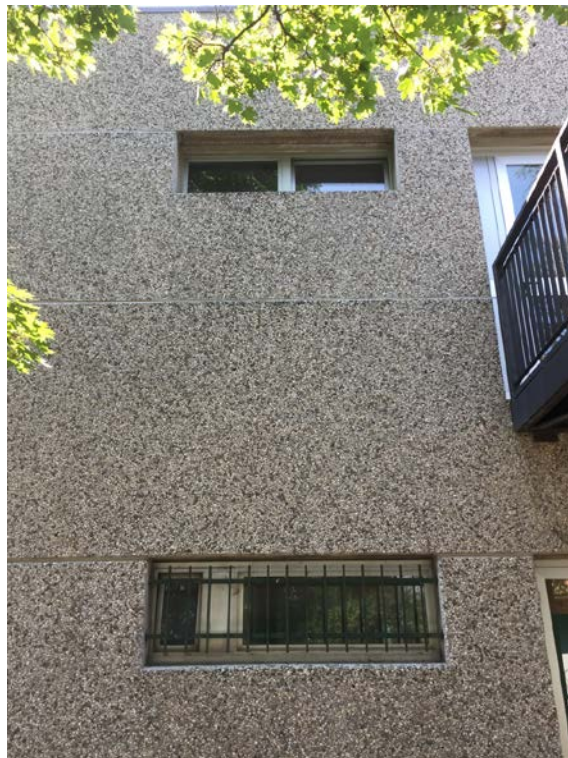
Fronte nord. Particolare serramenti bagni