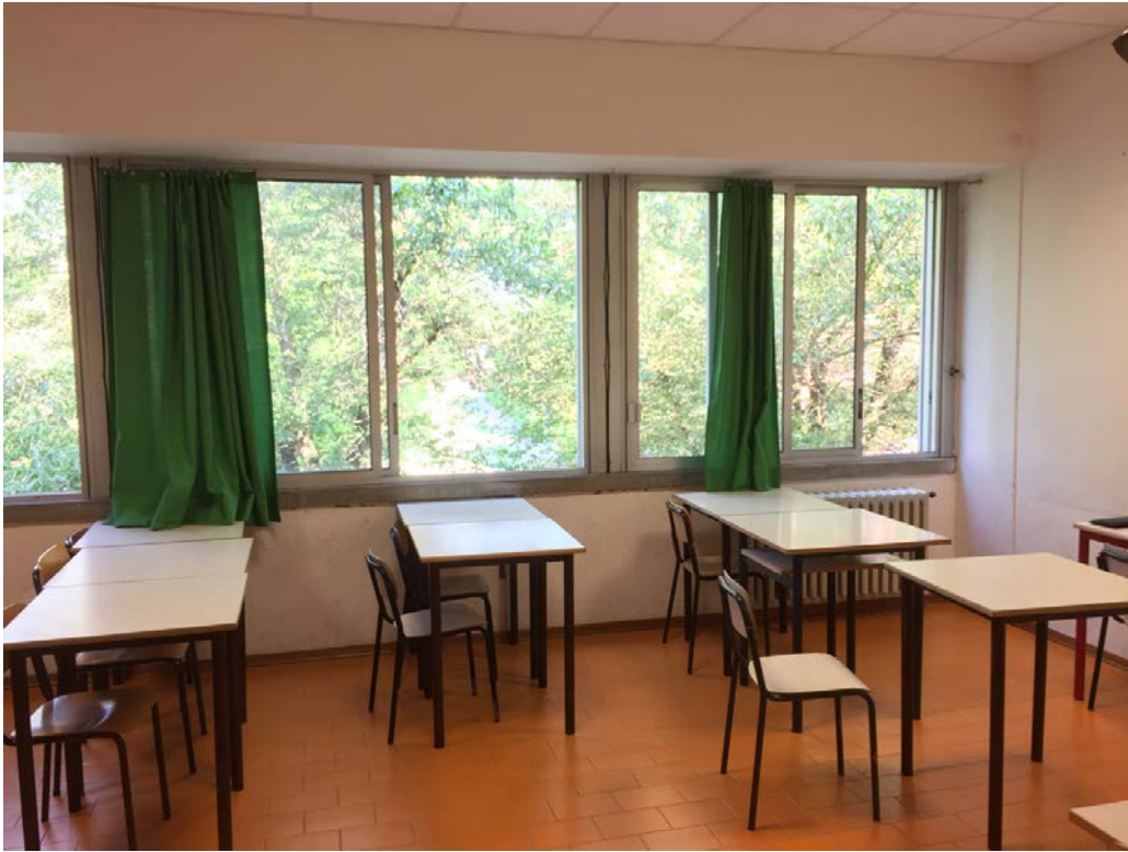
Particolare serramenti al primo piano