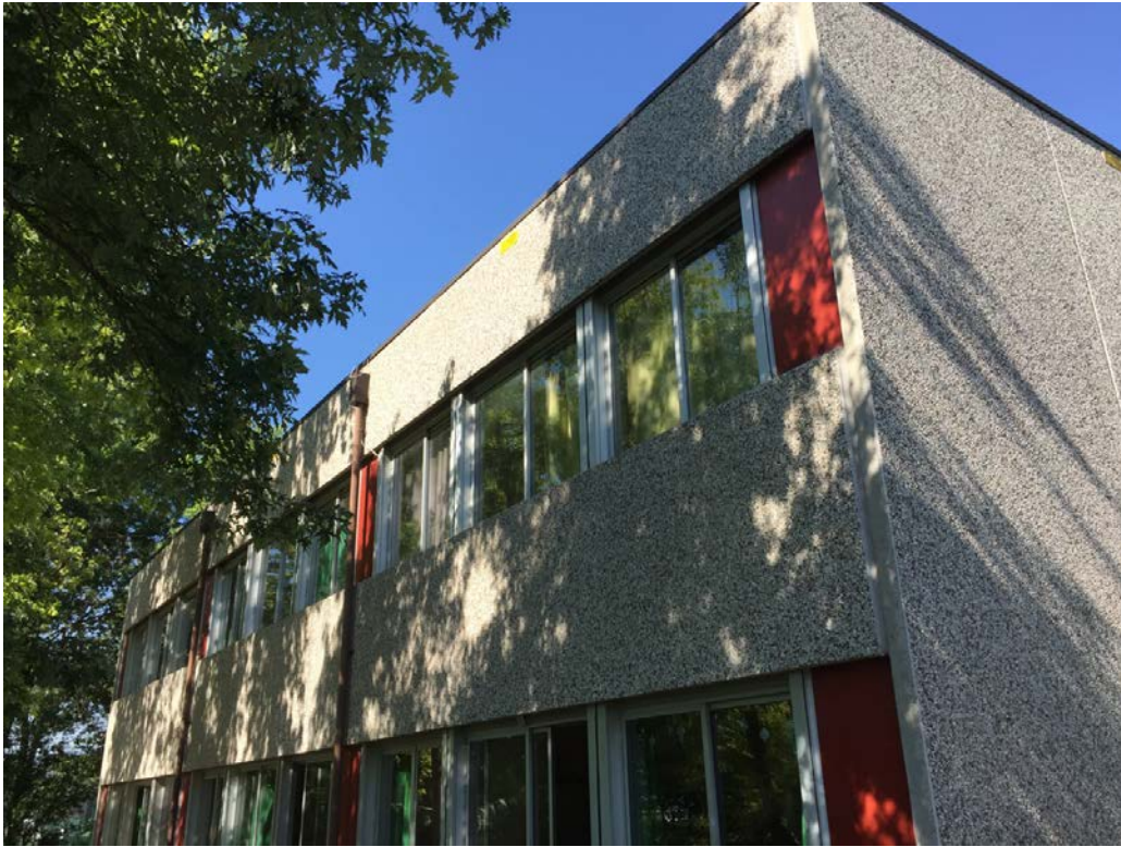
Fronte est e parte del fronte nord