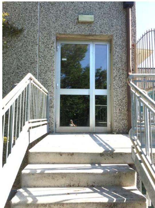
Fronte sud. Particolare porta antipanico al primo piano