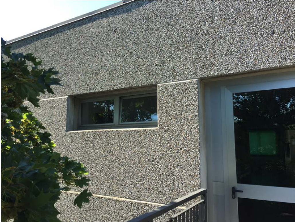
Fronte nord. Particolare serramento bagno piano primo