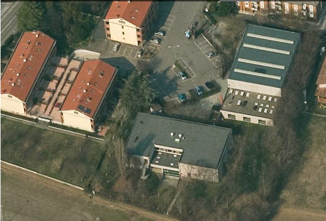
Vista aerea prima della posa dei pannelli fotovoltaici: copertura, fronti est e sud