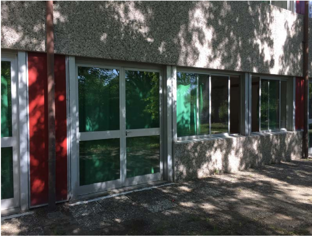
Particolare pannello che copre il pilastro in corrispondenza delle porte (fronte est)