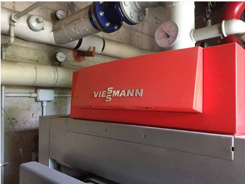
Particolare caldaia scuola e palestra