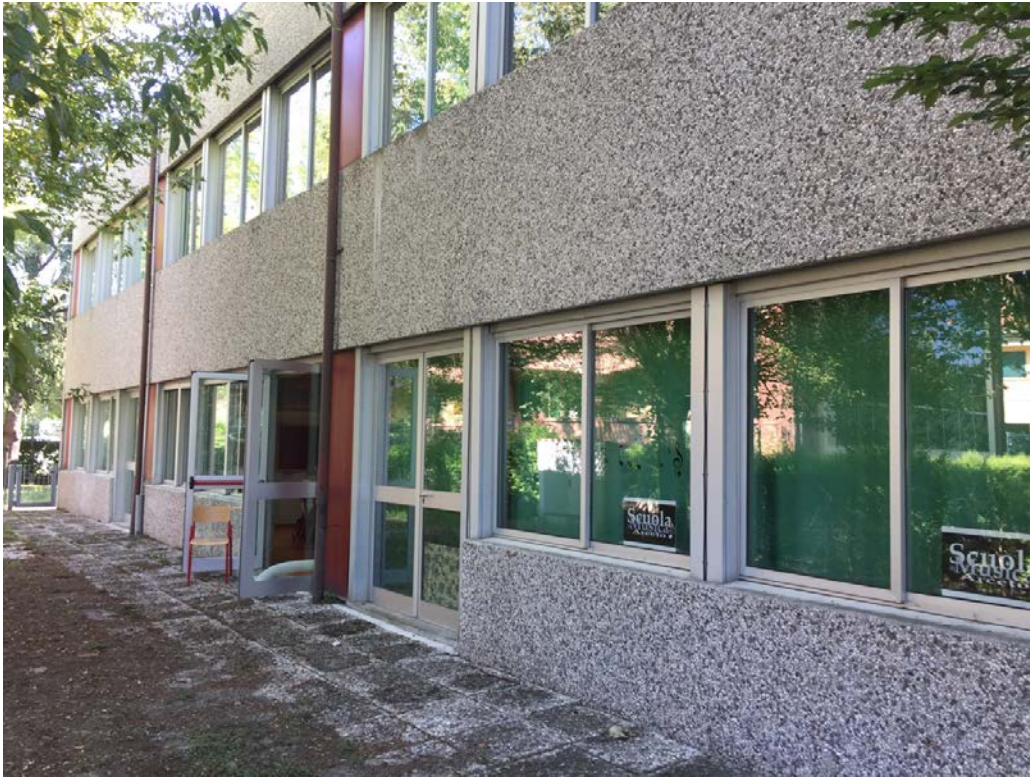
Fronte ovest visto da sud