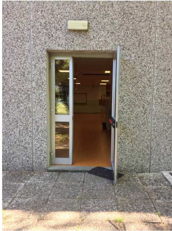
Fronte sud. Particolare porta antipanico al primo terra