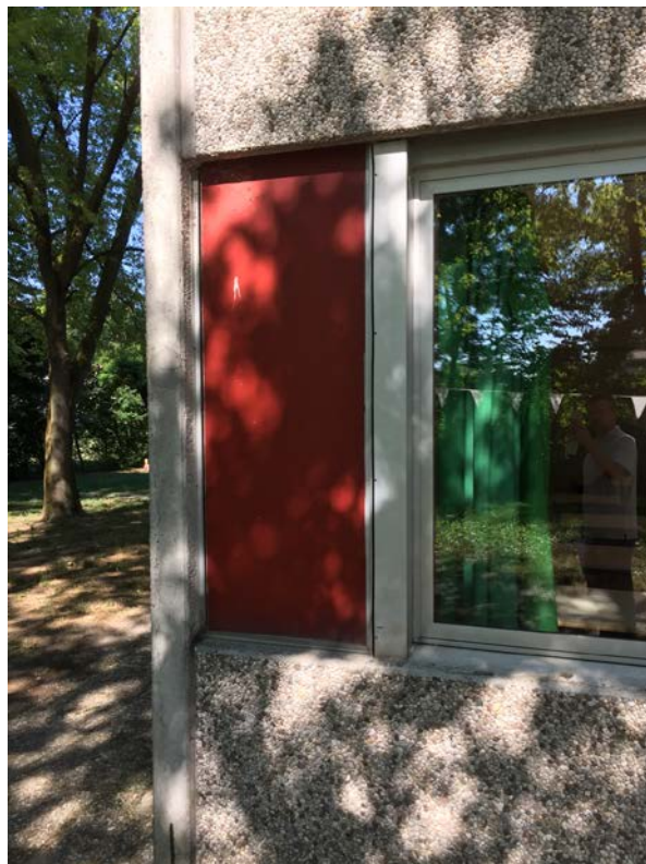
Particolare pannello che copre il pilastro (fronte est)