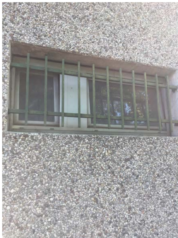
Fronte sud. Particolare finestra bagno