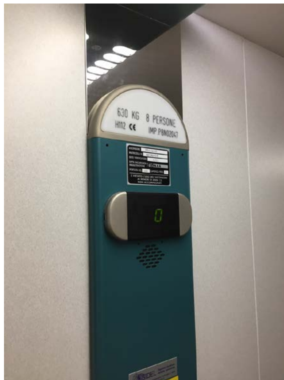
Carichi ammessi ascensore interno alla scuola