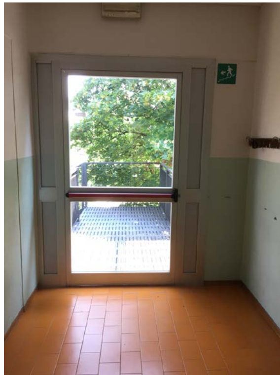
Porta antipanico al primo piano