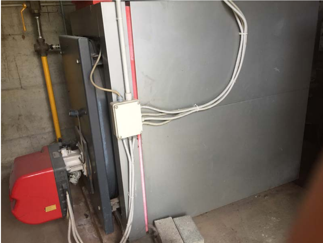
Caldaia scuola e palestra