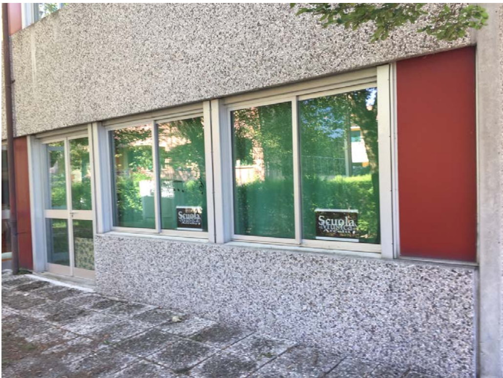
Fronte ovest. Particolare aula di musica