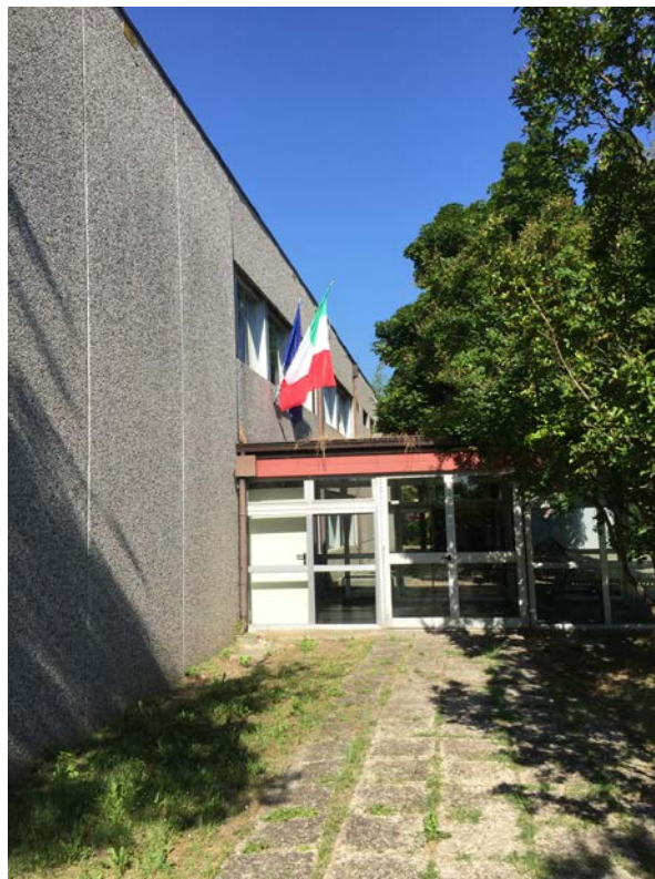
Fronte nord visto da est