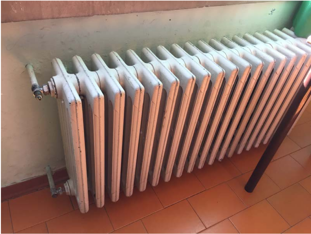
Termosifone tipo all'interno delle classi