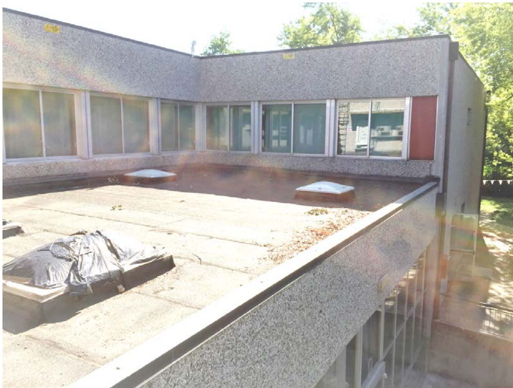
Fronte sud. Particolare serramenti al primo piano