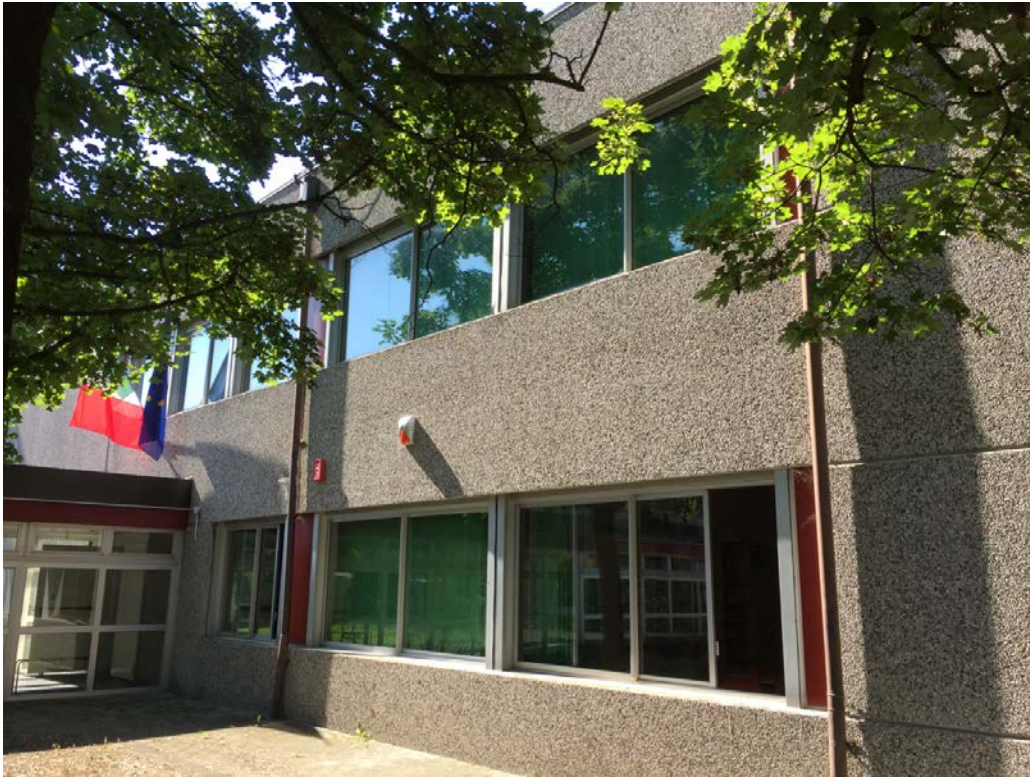
Fronte nord visto da ovest, in corrispondenza dell'ingresso alla scuola