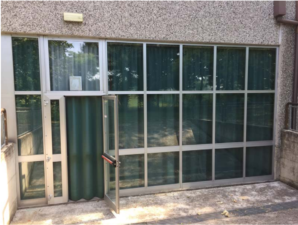
Fronte sud. Particolare serramento gradinata teatrino