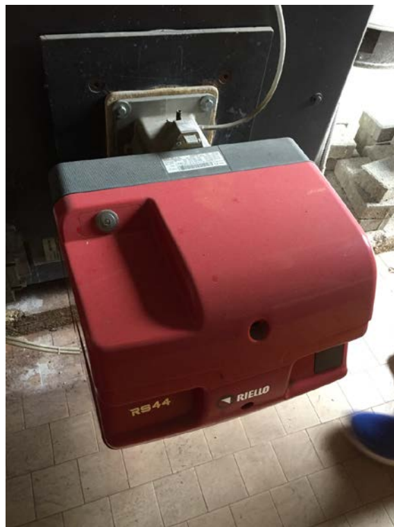
Particolare bruciatore caldaia