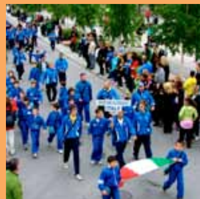
PITEÅ SUMMER GAMES 2011

Il CD sarà disponibile a breve per la consultazione presso la Biblioteca G. Salvemini di Scandiano in lingua italiana e inglese.