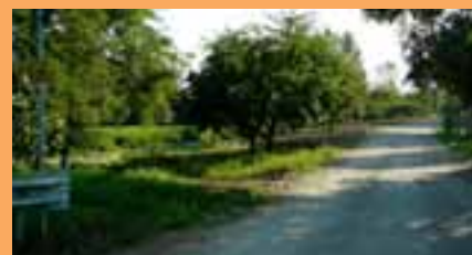
DOPO LA RIMOZIONE...

L'amministrazione ha pertanto ritenuto indispensabile rimuovere le condizioni di degrado ambientale e paesaggistico soprattutto in relazione alla vicinanza del sito a strutture scolastiche ed aree pubbliche, e rendere pienamente attuabili le previsioni progettuali per la riqualificazione viaria di Via Morsiani, mediante l'eliminazione delle strutture di recinzione abusivamente a ridosso del margine stradale.