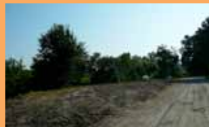
Orti abusivi rimossi in Via del Mulino. Qui la situazione è tornata alla normalità dopo l'ordinanza.