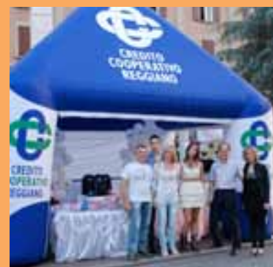
WOW 2011 – LA MERAVIGLIOSA NOTTE DI SCANDIANO

// Grazie a tutti per aver partecipato. Grazie ai negozi, alle associazioni, ai volontari, agli uffici comunali. //