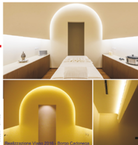
Realizzazione Viano 2018 - Borgo Cadonega

MONTEDIL S.r.l. Via Prandi, 5 - 42019 - Bosco di Scandiano (RE) Tel. 0522.855543 (r.a.) Fax 0522.855544 info@montedil.it - www.montedil.it