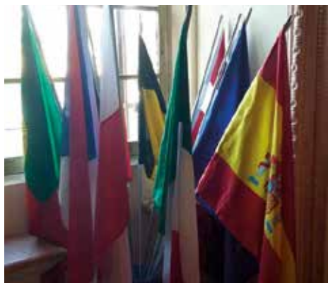
Bandiere in Rocca per MigrArt