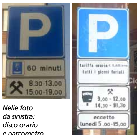
Nelle foto da sinistra: disco orario e parcometro

Di regola tale segnaletica viene posta in quelle zone ove anche una brevissima fermata del veicolo può essere pericolosa. Si pensi per esempio nelle vicinanze di determinate intersezioni pericolose ove anche un momentaneo arresto del veicolo può togliere visibilità a coloro che si apprestano ad effettuare l'attraversamento. In assenza di indicazioni integrative il divieto ha valore permanente 00-24. Per sosta si intende la sospensione della marcia del veicolo protratta nel tempo, con possibilità di allontanamento da parte del conducente. Nei luoghi in cui viene posizionata tale segnaletica, è vietata la sosta ma è ammessa la fermata a condizione che non si arrechi intralcio alla circolazione. Il conducente deve essere presente in prossimità del veicolo pronto a riprendere la marcia. In assenza di prescrizioni integrative in centro abitato il divieto di sosta è valido dalle 08.00 alle 20.00 mentre fuori dal centro abitato è permanente 00-24. È ammessa l'istituzione di divieti temporanei con le stesse regole che abbiamo citato in riferimento al divieto di fermata. Il mancato rispetto della prescrizione comporta una sanzione amministrativa di euro 39,00. La sanzione pecuniaria può essere ripetuta per ogni giorno in cui si protrae la violazione. La rimozione è prevista solo in presenza di apposito pannello integrativo