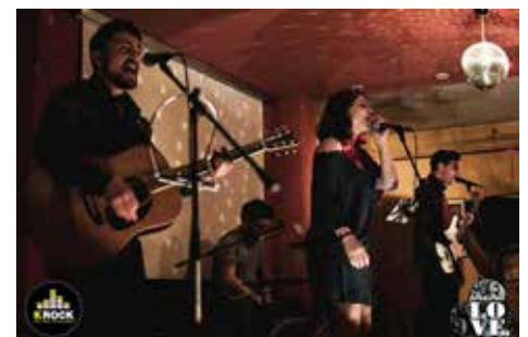
In foto il gruppo CarpiRé Mo vincitore della scorsa edizione proveniente da Carpi (MO), un quartetto che propone musica di genere modern folk.

la prossima edizione di festivaLOVE a maggio 2017. Un'apposita trasmissione radiofonica di Krock creata per l'occasione andrà in onda martedì 3 maggio alle ore 20 e annuncerà in diretta tutti i nomi delle band finaliste (le più votate dal pubblico più quelle della giuria).