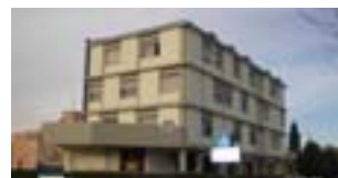
Risanamento delle strutture in cemento armato

Nuove tecnologie per il risanamento del cemento armato