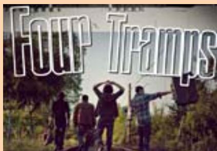
FOUR TRAMPS Via Crispi di fronte fruttivendolo