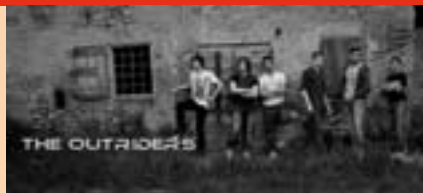
THE OUTRIDERS Via Mateotti