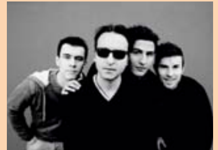
BARLUME Corso Garibaldi zona Sisley