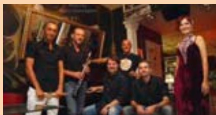
THE STUMBLE angolo tra P.zza Libertà e Corso Garibaldi