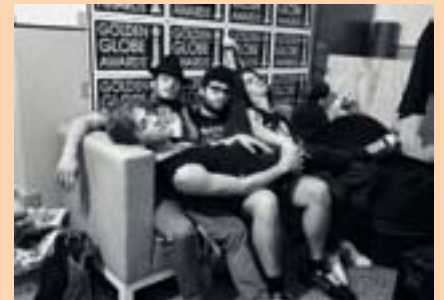
DEEP HOAX Via Fogliani di fronte profumeria Jolly