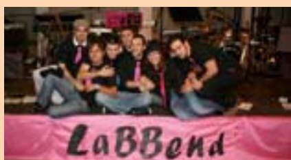
LABBEND P.zza Nuovo Mondo