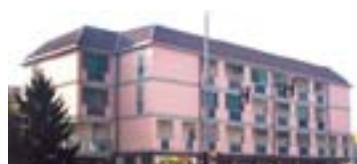
Risanamento delle strutture in cemento armato

Nuove tecnologie per il risanamento del cemento armato