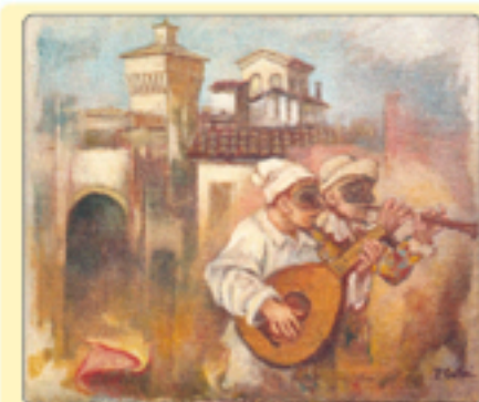
Carnevale a Scandiano - Olio su tela di Paris Cutini